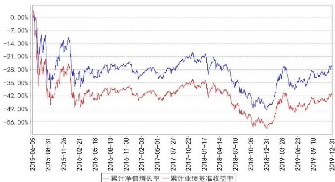
大成深证ETF累计净值增长率与同期业绩比较基准收益率的历史走势对比图

注：本基金合同规定，基金管理人应当自基金合同生效之日起六个月内使基金的投资组合比例符合基金合同的有关约定。建仓期结束时，本基金的投资组合比例符合基金合同的约定。