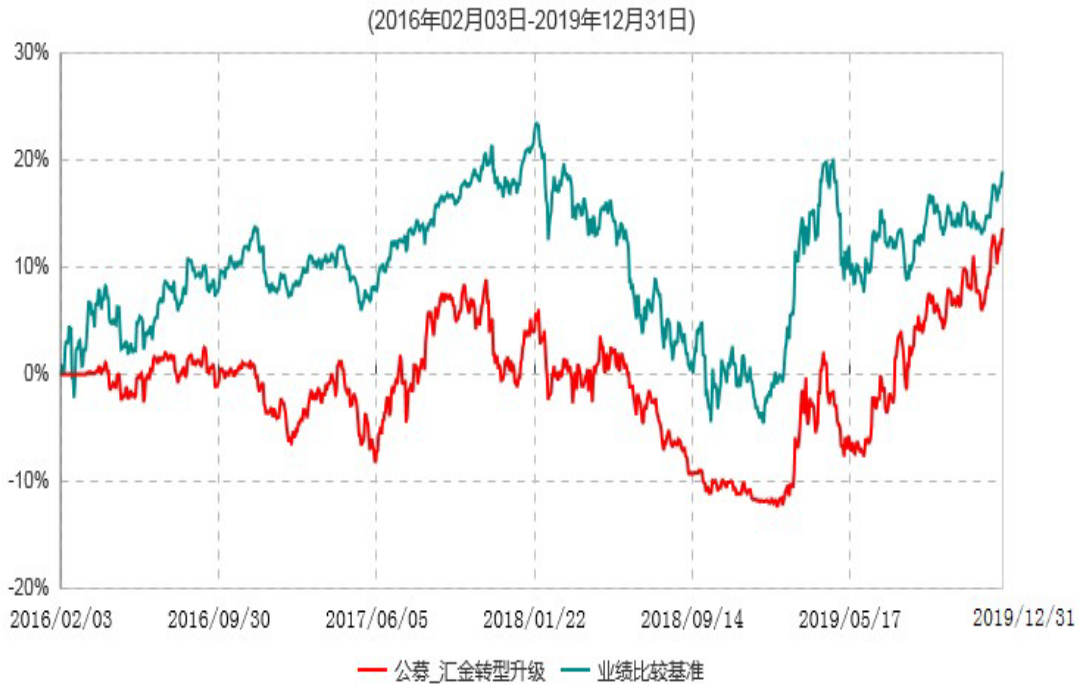
浙商汇金转型升级灵活配置混合型证券投资基金累计净值增长率与业绩比较基准收益率历史走势对比图