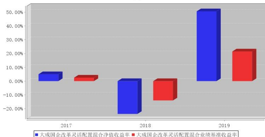
大成国企改革灵活配置混合基金每年净值增长率与同期业绩比较基准收益率的对比图