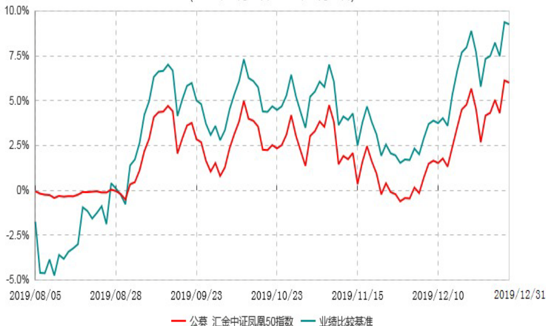
浙商汇金中证浙江凤凰行动50交易型开放式指数证券投资基金累计净值增长率与业绩比较基准收益率历史走势对比图 (2019年08月05日-2019年12月31日)

注：本基金合同生效日为2019年08月05日，自合同生效日起至本报告期末不足一年。截止报告期末，本基金建仓期尚未结束。