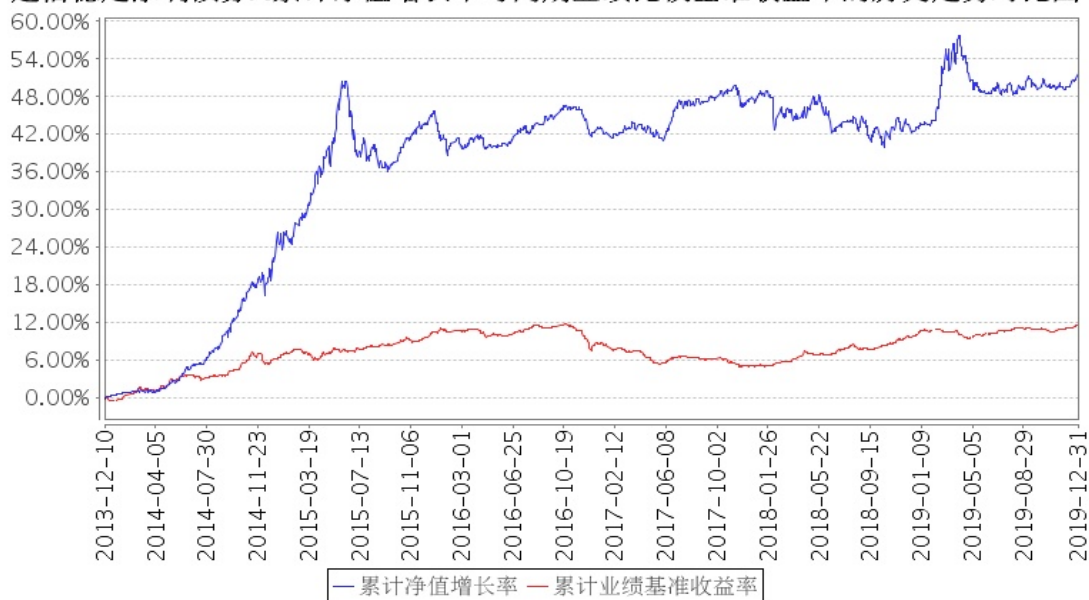
建信稳定添利债券A累计净值增长率与同期业绩比较基准收益率的历史走势对比图