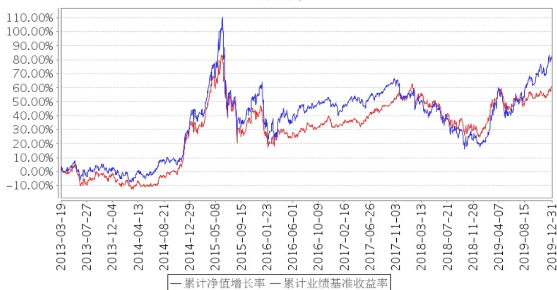
建信优势动力混合（LOF）累计净值增长率与同期业绩比较基准收益率的历史走势对比图