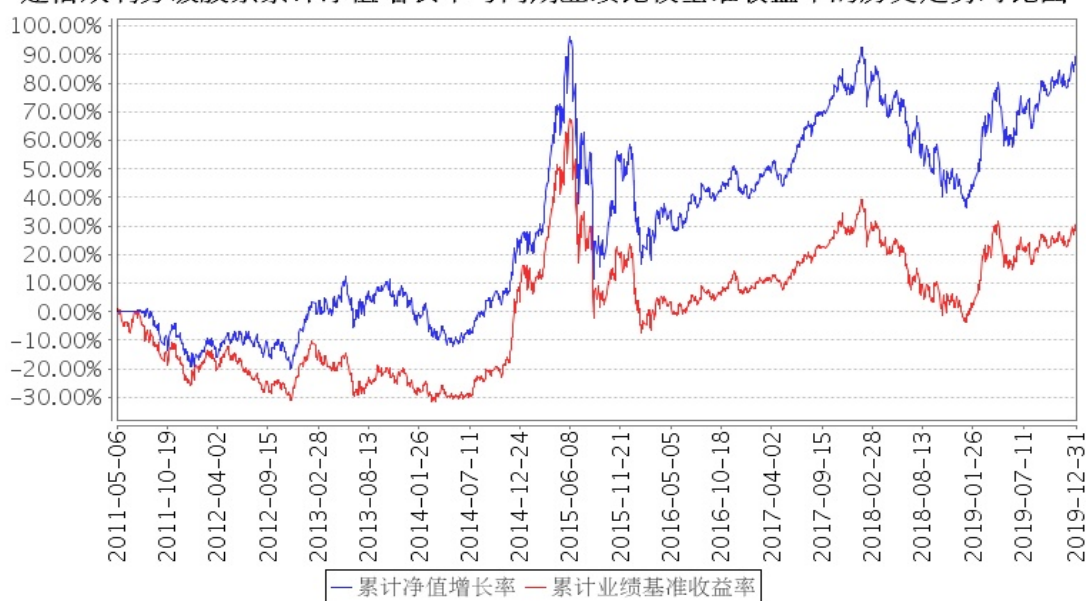
建信双利分级股票累计净值增长率与同期业绩比较基准收益率的历史走势对比图