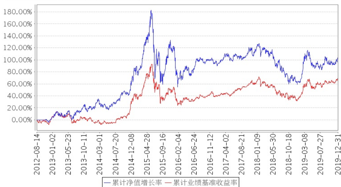
建信社会责任混合累计净值增长率与同期业绩比较基准收益率的历史走势对比图