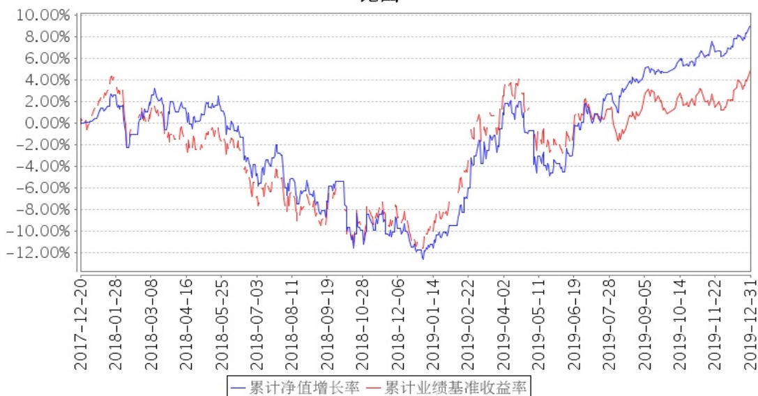
建信鑫稳回报灵活配置A累计净值增长率与同期业绩比较基准收益率的历史走势对比图