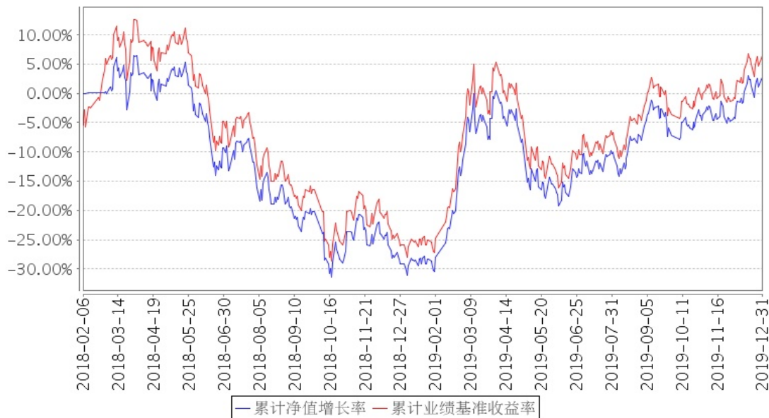
建信创业板ETF累计净值增长率与同期业绩比较基准收益率的历史走势对比图