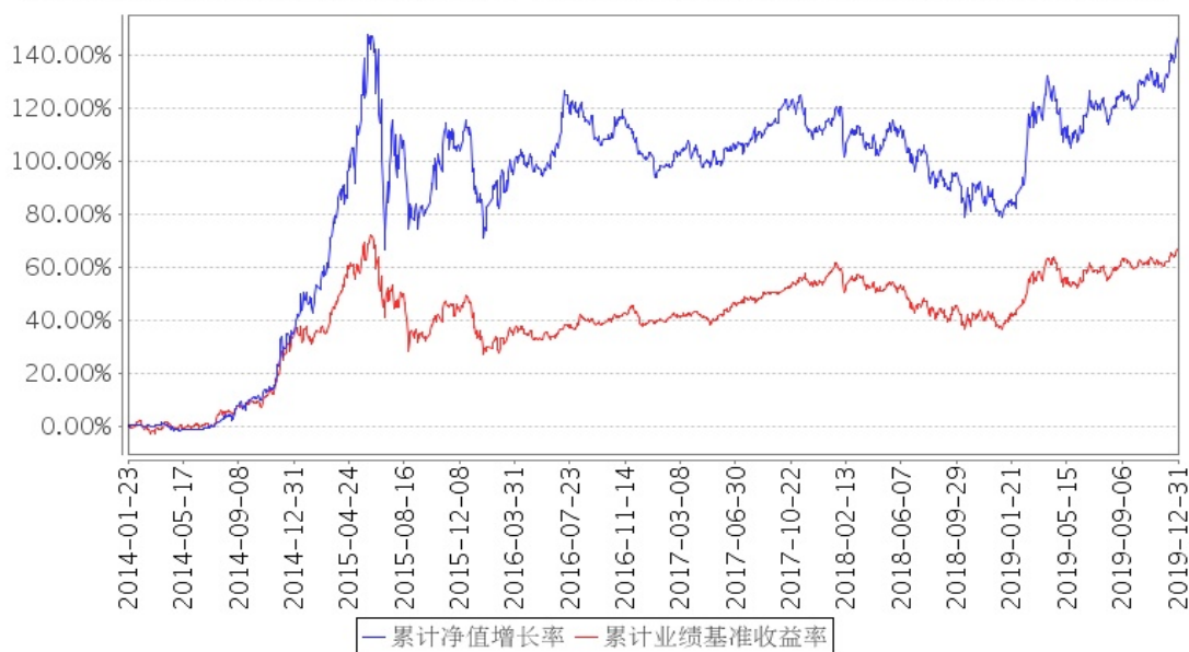
建信积极配置混合累计净值增长率与同期业绩比较基准收益率的历史走势对比图