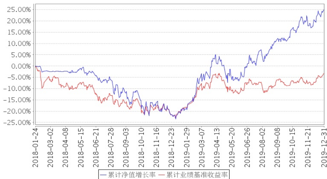
建信龙头企业股票累计净值增长率与同期业绩比较基准收益率的历史走势对比图