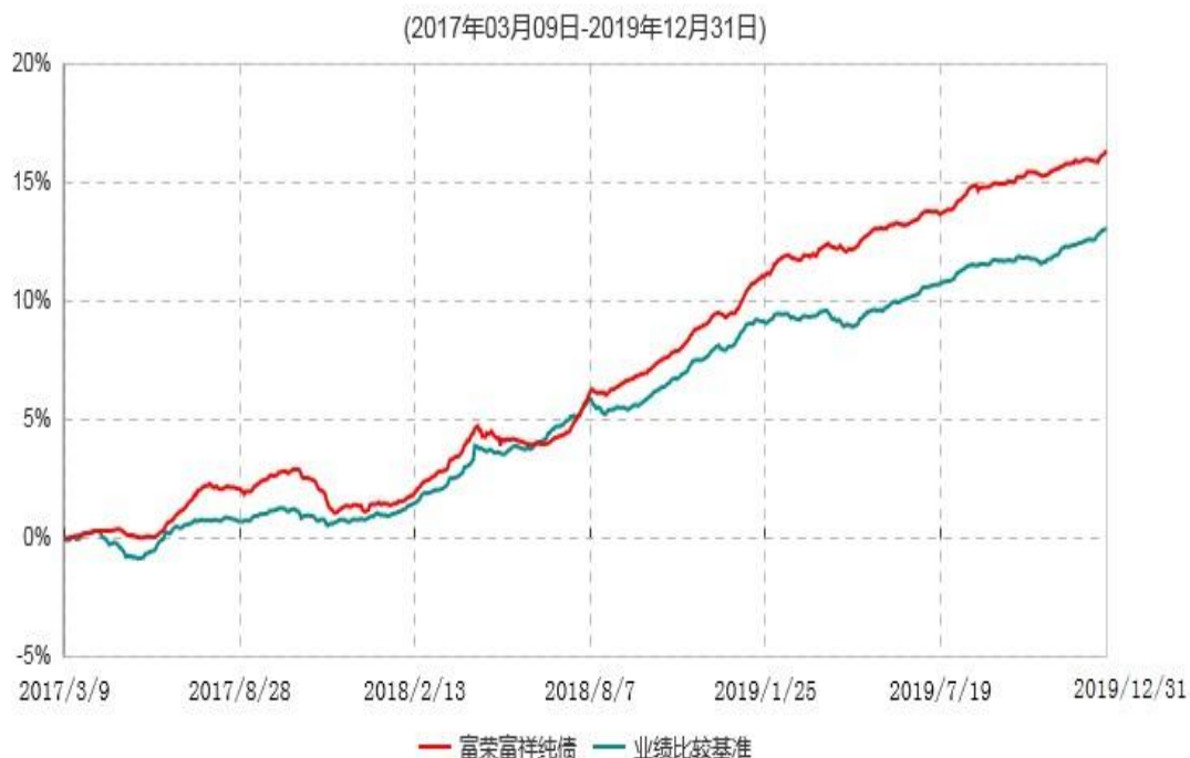
富荣富祥纯债债券型证券投资基金累计净值增长率与业绩比较基准收益率历史走势对比图