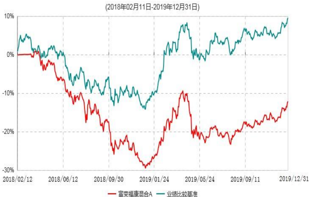
富荣福康混合C累计净值增长率与业绩比较基准收益率历史走势对比图