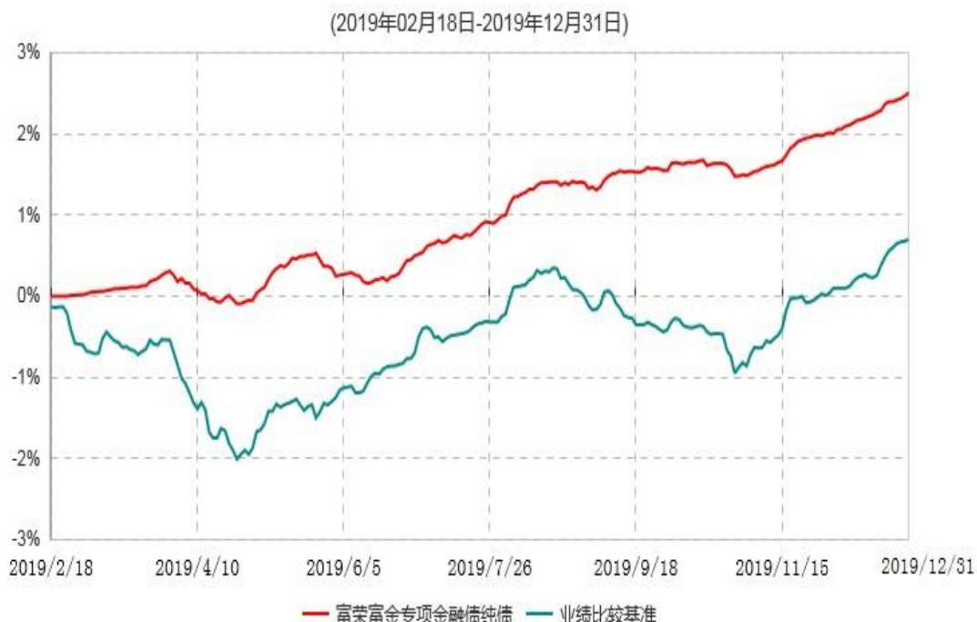
富荣富金专项金融债纯债债券型证券投资基金累计净值增长率与业绩比较基准收益率历史走势对比图

注：①本基金基金合同于2019年2月18日生效，截止2019年12月31日止，本基金成立未 满一年；