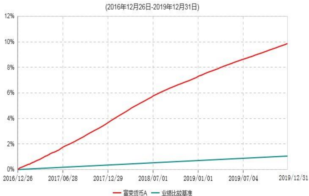
富荣货币A累计净值收益率与业绩比较基准收益率历史走势对比图