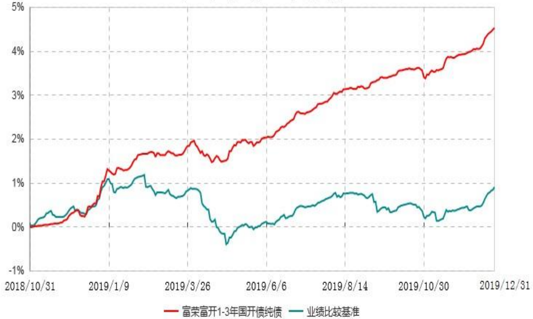
富荣富开1-3年国开债纯债债券型证券投资基金累计净值增长率与业绩比较基准收益率历史走势对比图 (2018年10月31日-2019年12月31日)