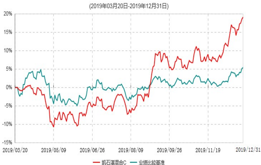
凯石湛混合C累计净值增长率与业绩比较基准收益率历史走势对比图

注：本基金于 2019 年 03 月 20 日成立，自合同生效起至本报告期不满一年。