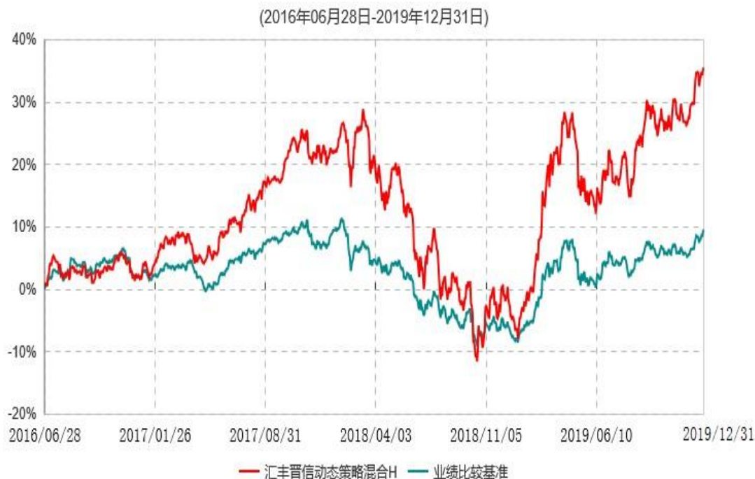
汇丰晋信动态策略混合H累计净值增长率与业绩比较基准收益率历史走势对比图