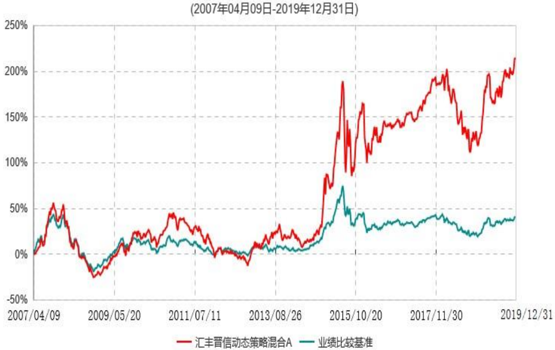
汇丰晋信动态策略混合A累计净值增长率与业绩比较基准收益率历史走势对比图