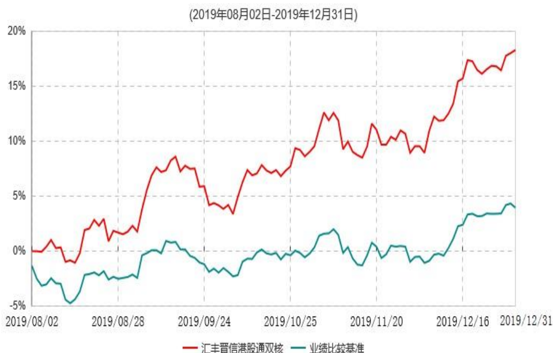
汇丰晋信港股通双核策略混合型证券投资基金累计净值增长率与业绩比较基准收益率历史走势对比图