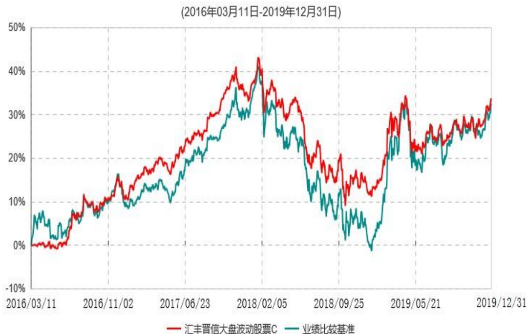
汇丰晋信大盘波动股票C累计净值增长率与业绩比较基准收益率历史走势对比图