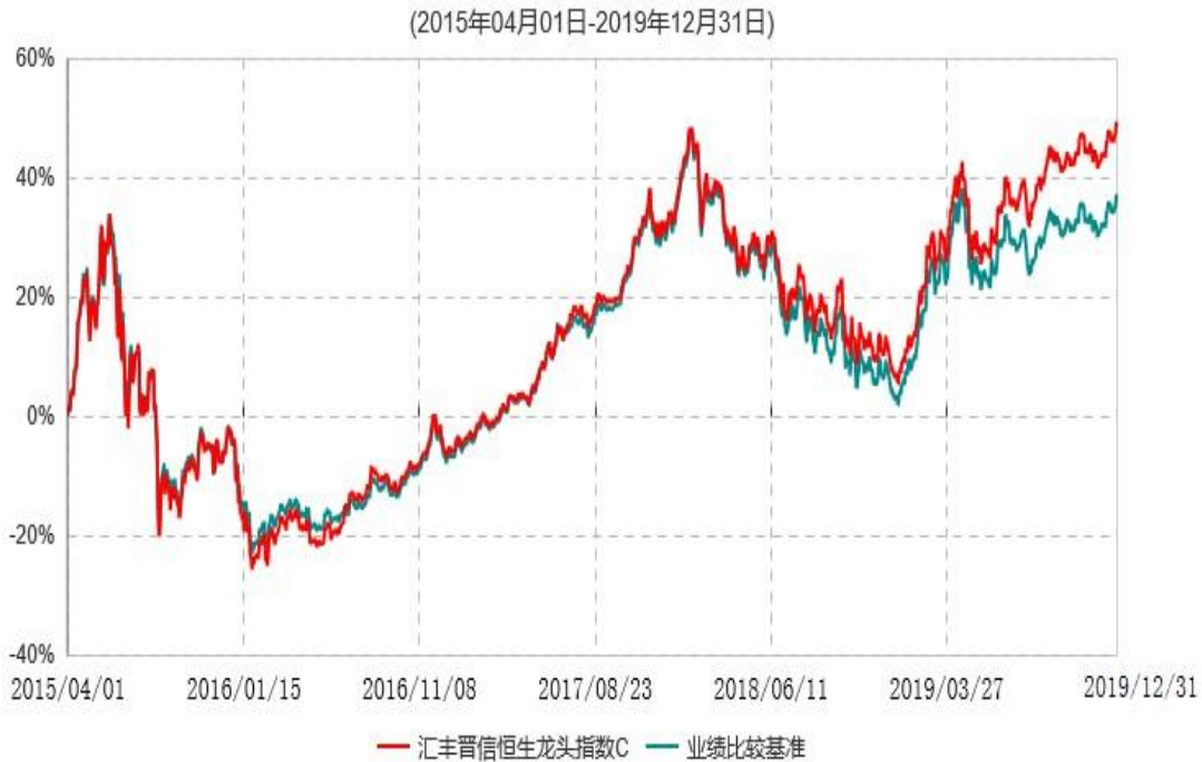
汇丰晋信恒生龙头指数C累计净值增长率与业绩比较基准收益率历史走势对比图