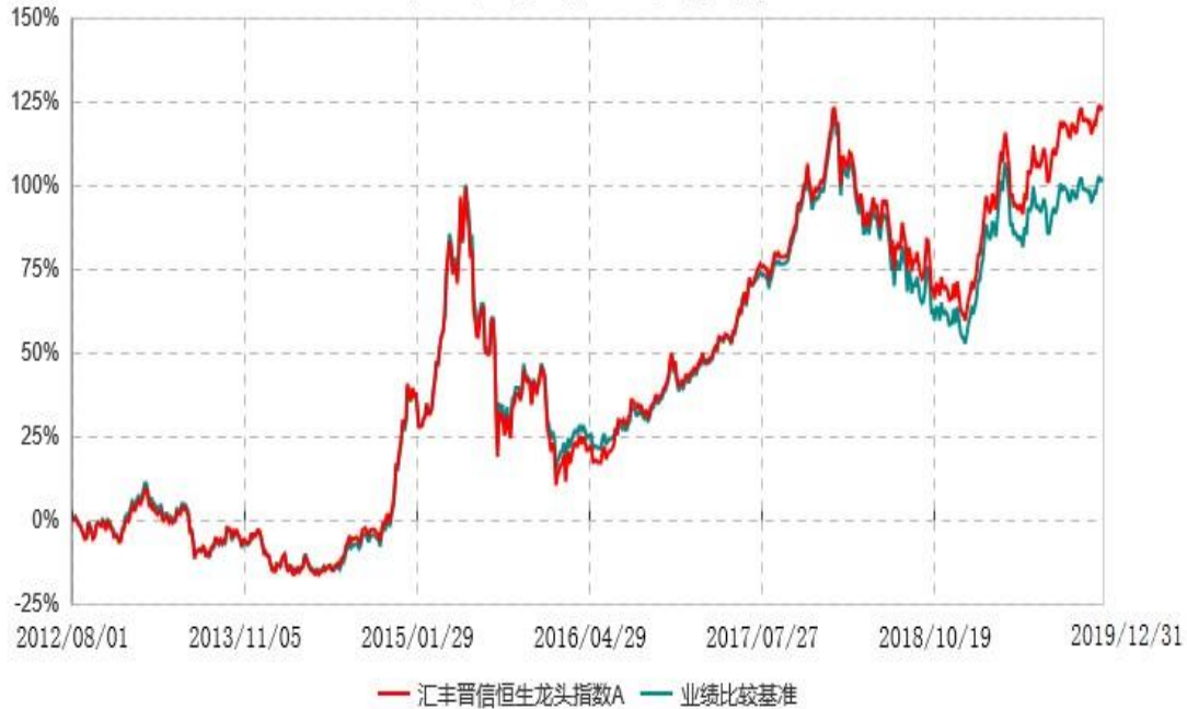
汇丰晋信恒生龙头指数A累计净值增长率与业绩比较基准收益率历史走势对比图 (2012年08月01日-2019年12月31日)