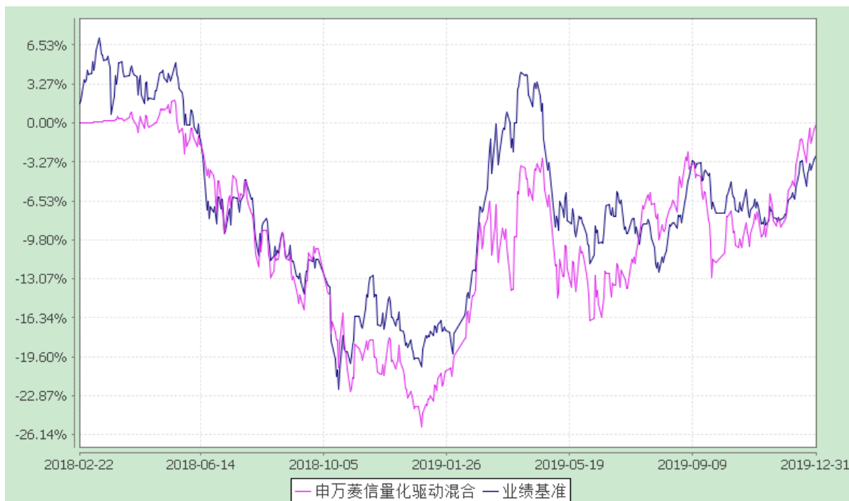
自基金合同生效以来份额累计净值增长率与业绩比较基准收益率的历史走势对比图 (2018 年 2 月 22 日至 2019 年 12 月 31 日)