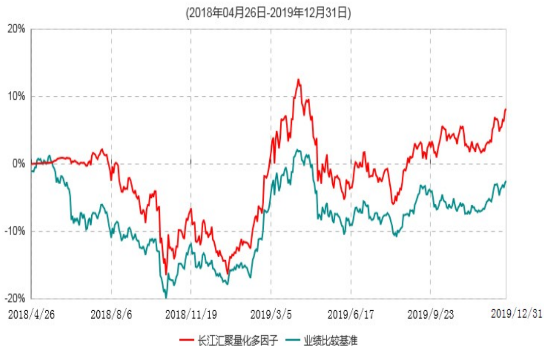
长江汇聚量化多因子灵活配置混合型发起式证券投资基金累计净值增长率与业绩比较基准收益率历史走势对比图