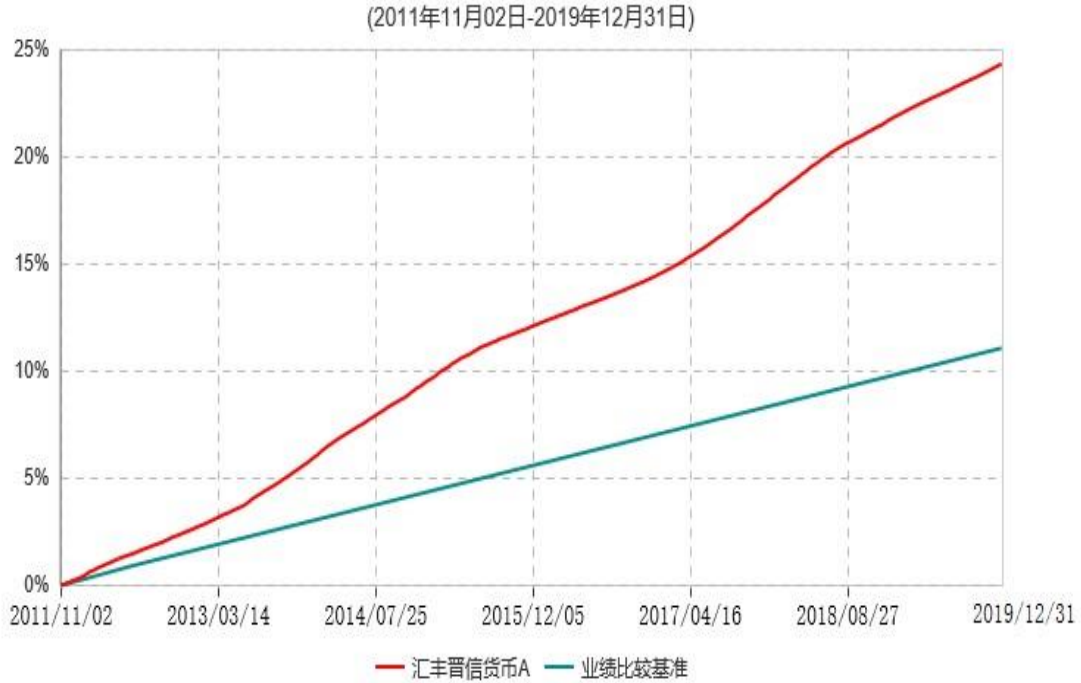
汇丰晋信货币A累计净值收益率与业绩比较基准收益率历史走势对比图