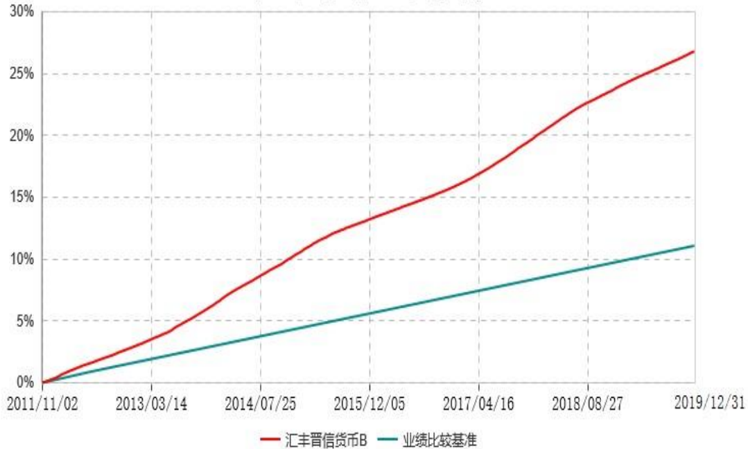
汇丰晋信货币B累计净值收益率与业绩比较基准收益率历史走势对比图 (2011年11月02日-2019年12月31日)