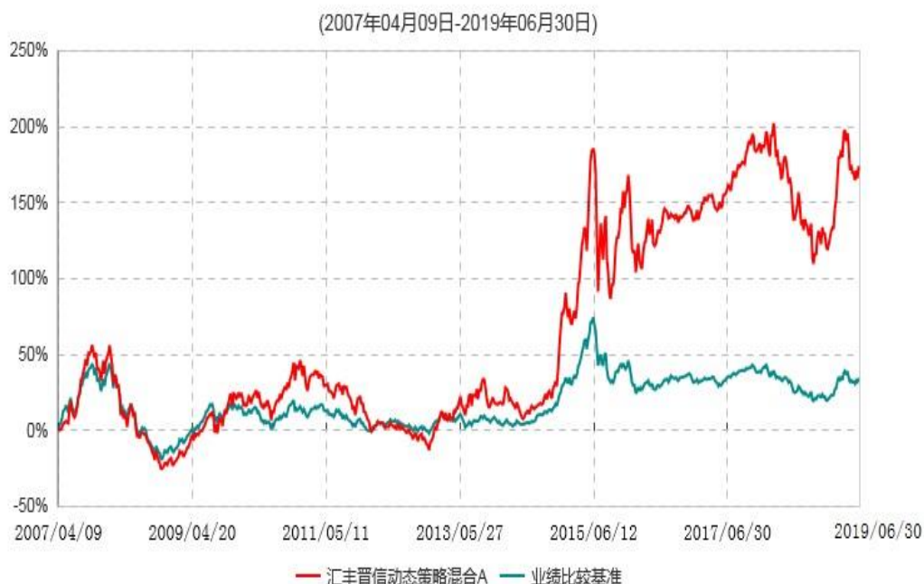
汇丰晋信动态策略混合A累计净值增长率与业绩比较基准收益率历史走势对比图