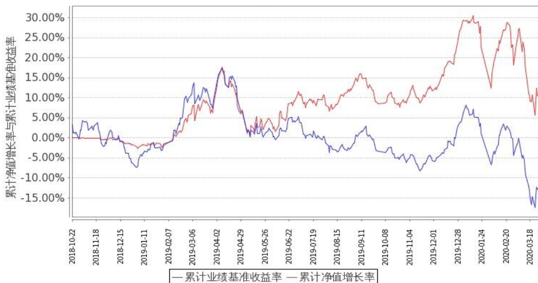
图 1：嘉实资源精选股票 A 基金份额累计净值增长率与同期业绩比较基准收益率的历史走势对比图