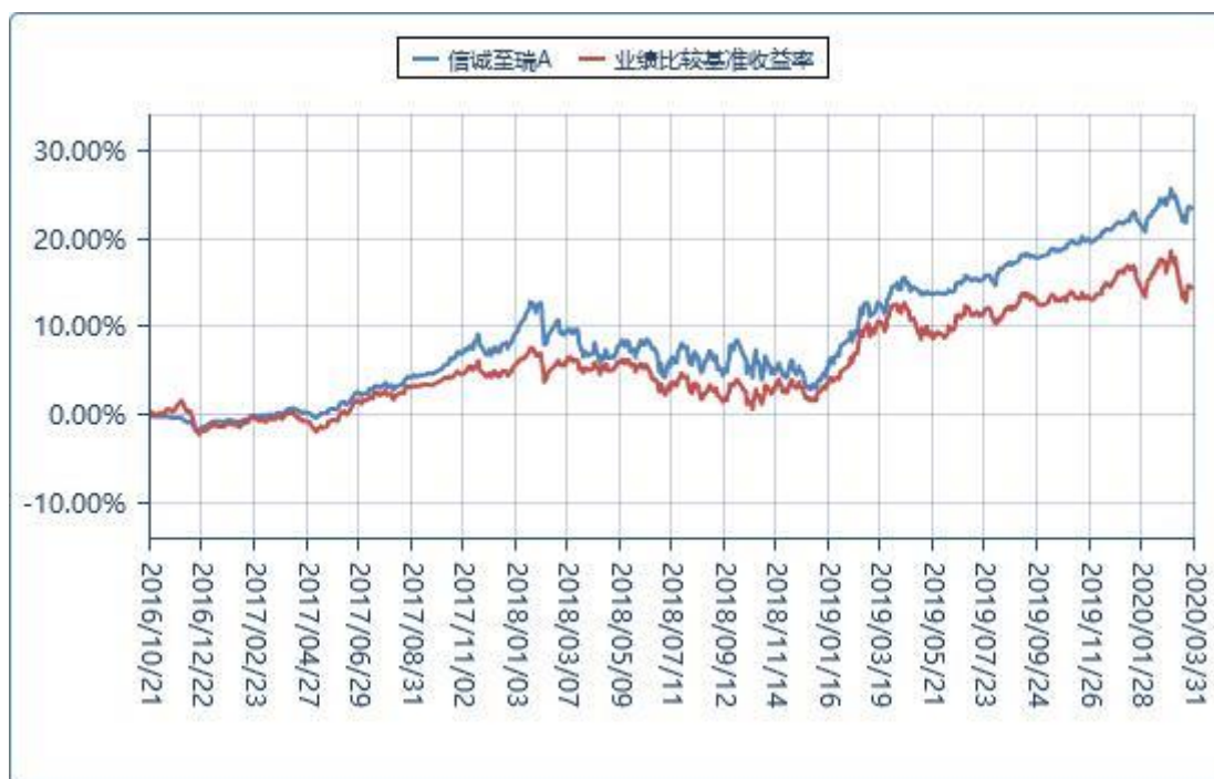
C级基金累计净值增长率与业绩比较基准收益率的历史走势对比图