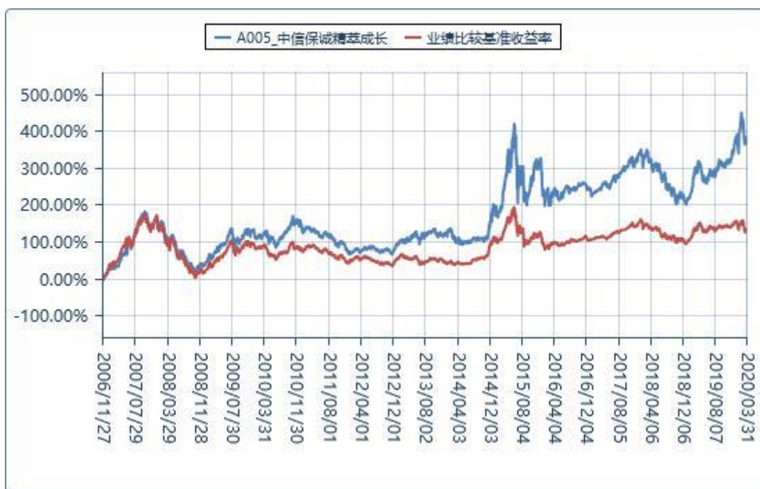
(二) 基金累计净值增长率与业绩比较基准收益率的历史走势对比图

注：1、本基金建仓期自 2006 年 11 月 27 日至 2007 年 5 月 26 日，建仓期结束时资产配置比例符合本基金基金合同规定。