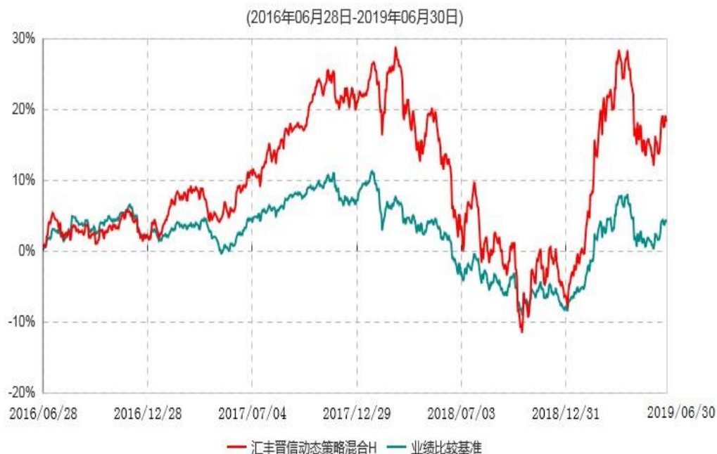
汇丰晋信动态策略混合H累计净值增长率与业绩比较基准收益率历史走势对比图

注：1. 按照基金合同的约定，本基金的投资组合比例为：股票占基金资产的30%–95%；除股票以外的其他资产占基金资产的5%–70%，其中现金（不包括结算备付金、存出保证金、应收申购款等）或到期日在一年期以内的政府债券的比例合计不低于基金资产净值的5%。