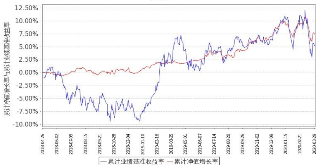
图 1：嘉实新添荣定期混合 A 基金份额累计净值增长率与同期业绩比较基准收益率的历史走势对比图