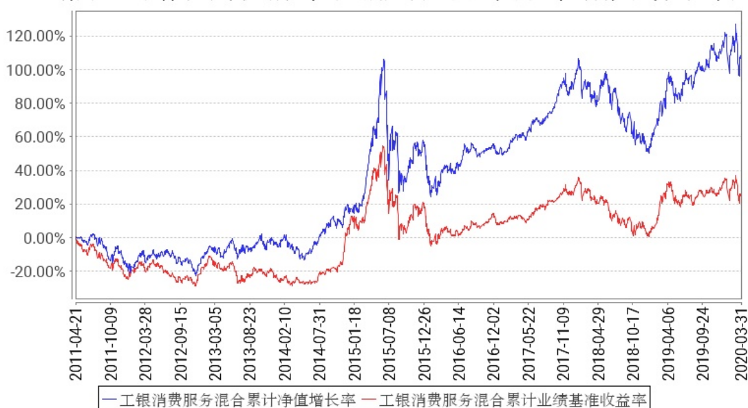
工银消费服务混合累计净值增长率与同期业绩比较基准收益率的历史走势对比图