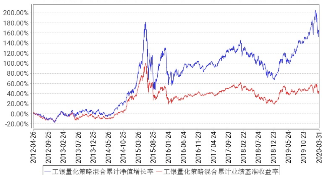
工银量化策略混合累计净值增长率与同期业绩比较基准收益率的历史走势对比图