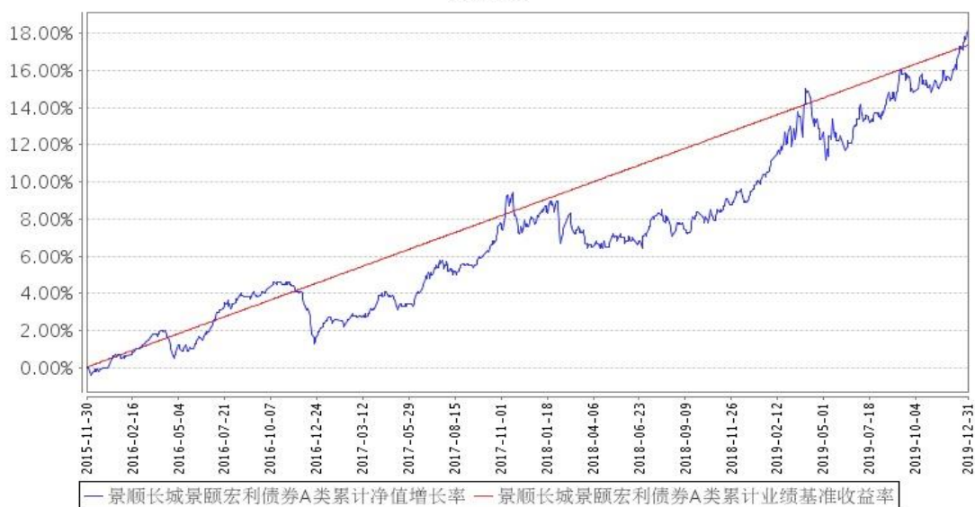
景顺长城景颐宏利债券A类累计净值增长率与同期业绩比较基准收益率的历史走势对比图