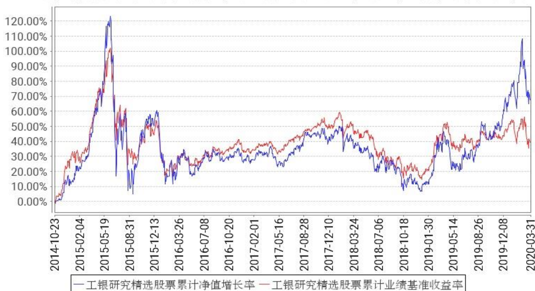
工银研究精选股票累计净值增长率与同期业绩比较基准收益率的历史走势对比图