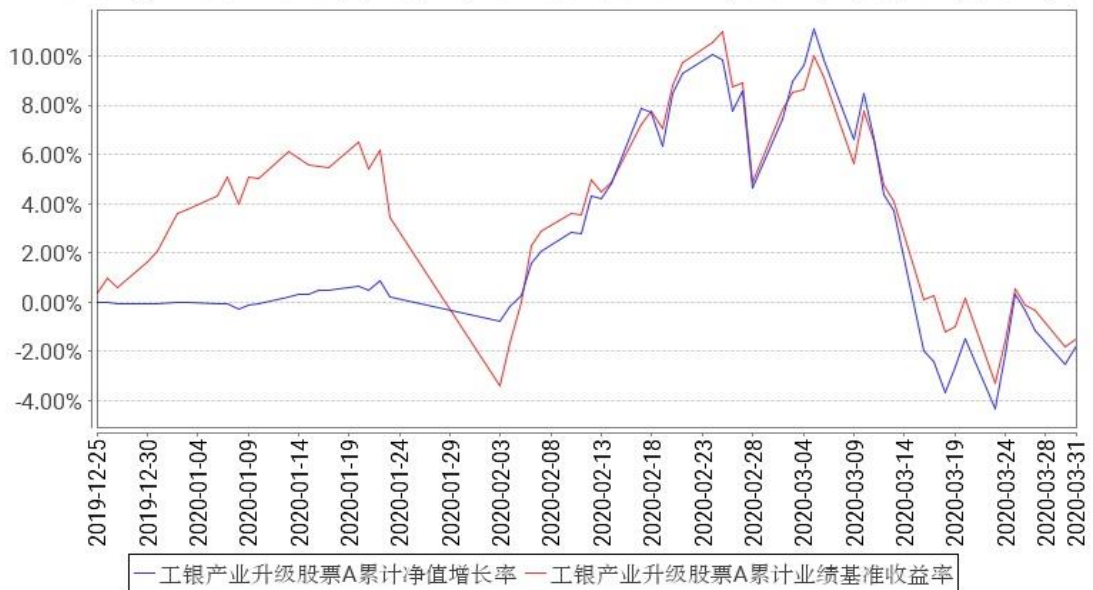
工银产业升级股票A累计净值增长率与同期业绩比较基准收益率的历史走势对比图