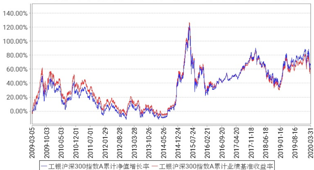
工银沪深300指数A累计净值增长率与同期业绩比较基准收益率的历史走势对比图

2、自基金合同生效以来基金累计净值增长率变动及其与同期业绩比较基准收益率变动的比较