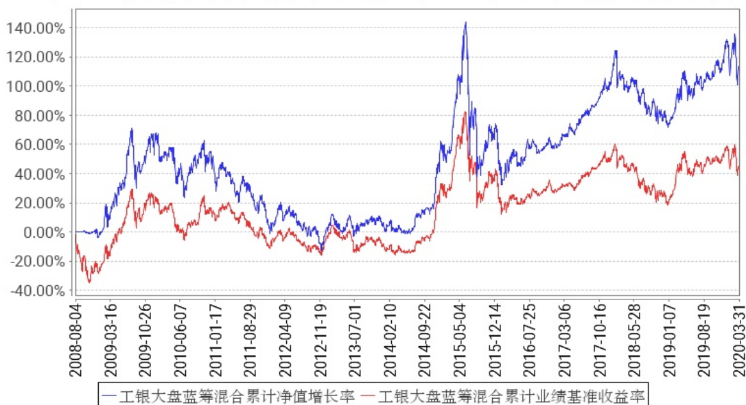
工银大盘蓝筹混合累计净值增长率与同期业绩比较基准收益率的历史走势对比图