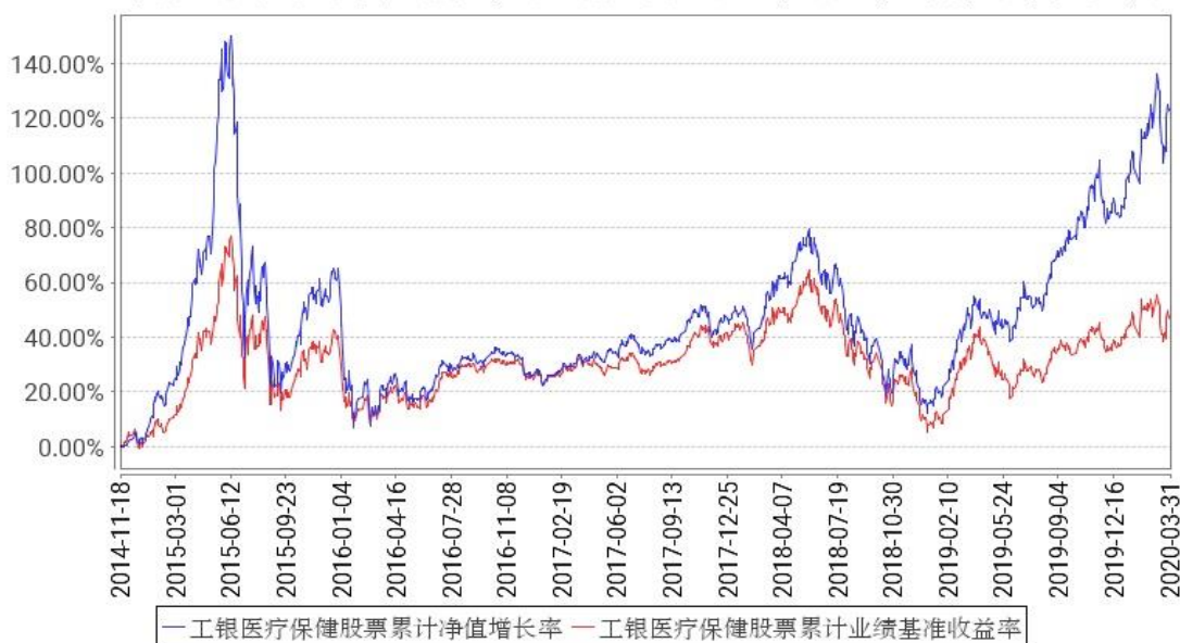
工银医疗保健股票累计净值增长率与同期业绩比较基准收益率的历史走势对比图