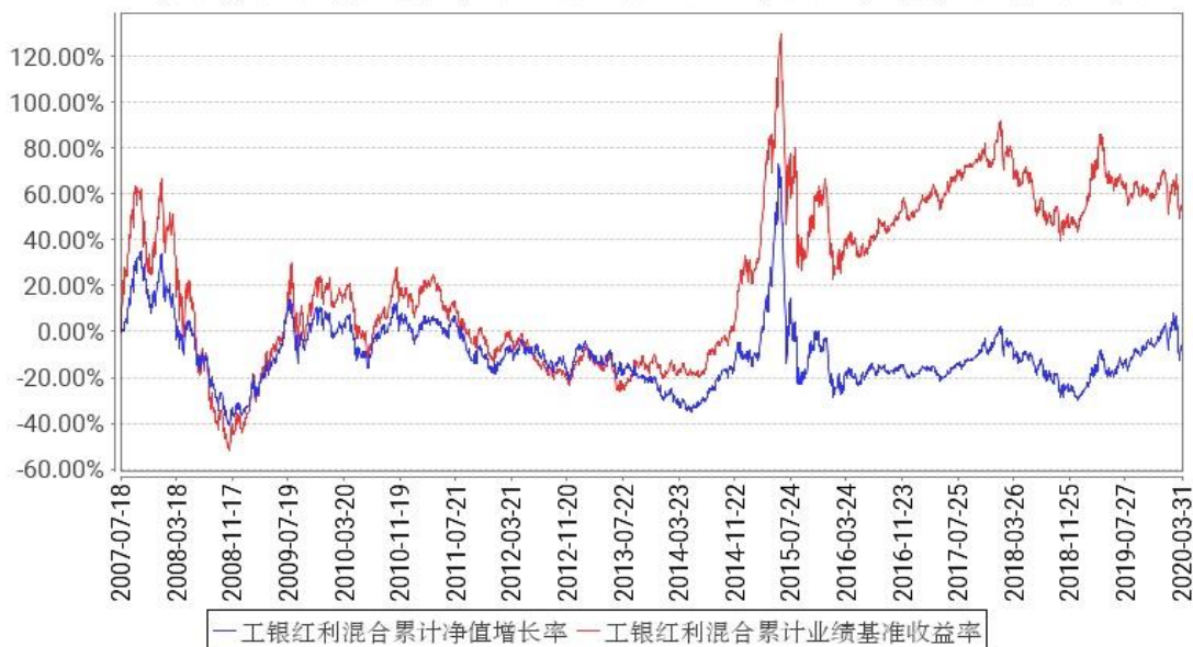
工银红利混合累计净值增长率与同期业绩比较基准收益率的历史走势对比图