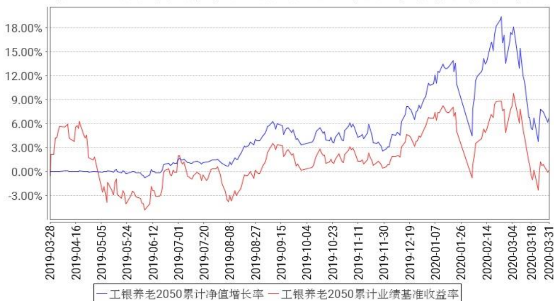
工银养老2050累计净值增长率与同期业绩比较基准收益率的历史走势对比图