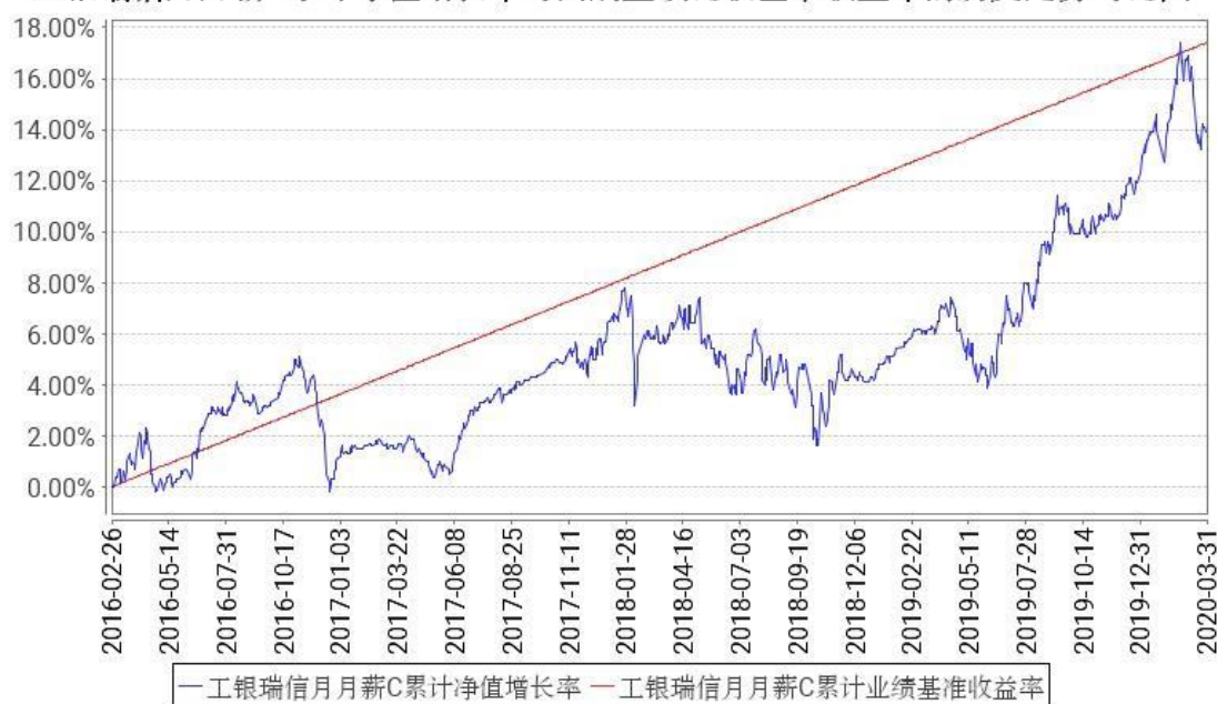
工银瑞信月月薪C累计净值增长率与同期业绩比较基准收益率的历史走势对比图