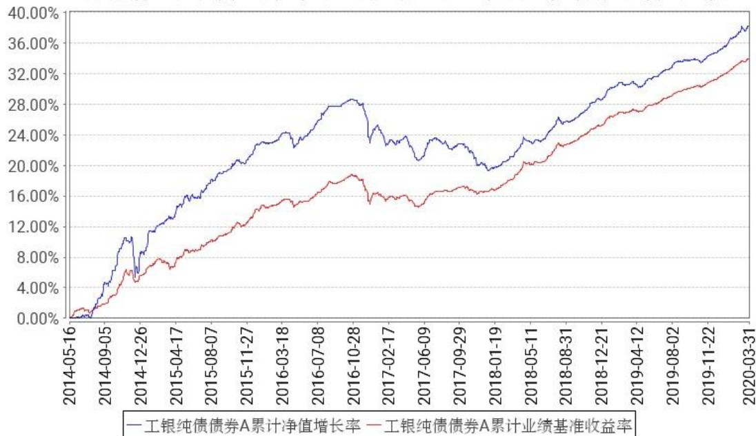
工银纯债债券A累计净值增长率与同期业绩比较基准收益率的历史走势对比图