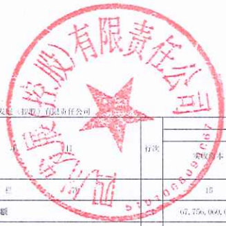
合并所有者权益变动表(续) 2010年度