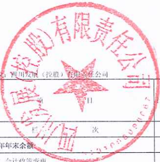
母公司所有者权益变动表（续） 2019年度