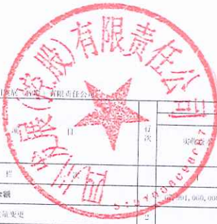
合并所有者权益变动表 2019年度