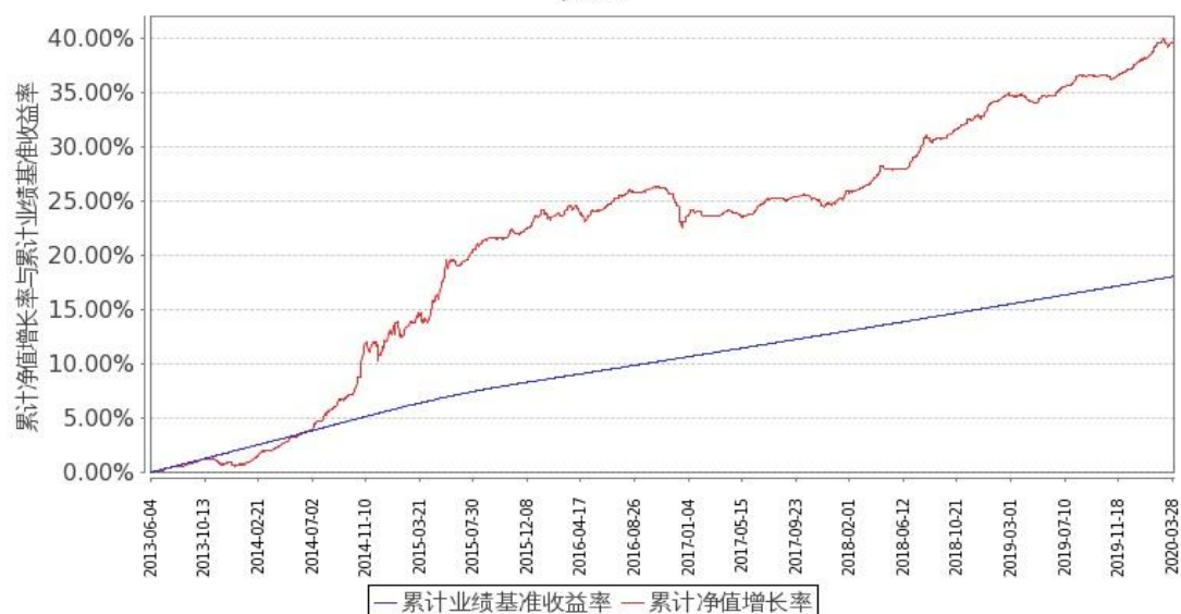
图2：嘉实如意宝定期债券C基金份额累计净值增长率与同期业绩比较基准收益率的历史走势对比图