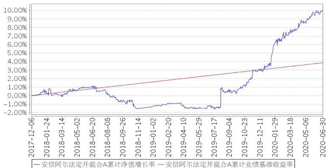
安信阿尔法定开混合A累计净值增长率与同期业绩比较基准收益率的历史走势对比图