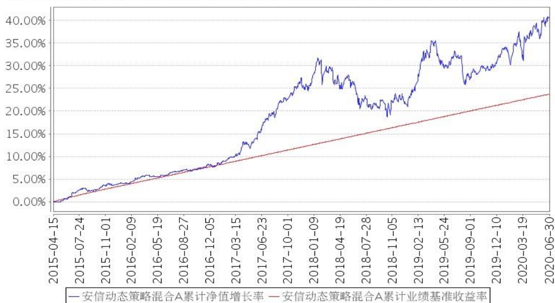
安信动态策略混合A累计净值增长率与同期业绩比较基准收益率的历史走势对比图