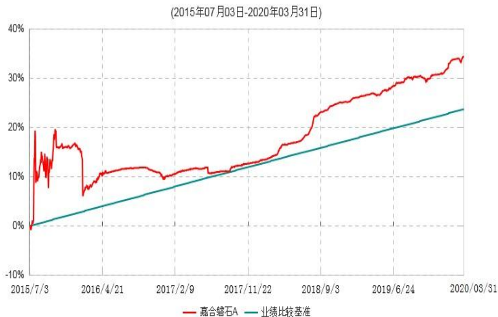
嘉合磐石A累计净值增长率与业绩比较基准收益率历史走势对比图