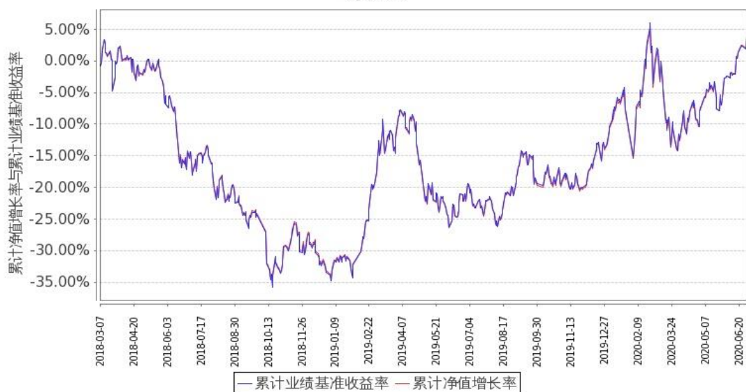
图 2：嘉实中创 400ETF 联接 C 基金份额累计净值增长率与同期业绩比较基准收益率的历史走势对比图 (2018 年 3 月 7 日至 2020 年 6 月 30 日)

注：按基金合同和招募说明书的约定，本基金自基金合同生效日起 3 个月内为建仓期，建仓期结束时本基金的各项投资比例符合基金合同“第十一部分二、投资范围和六、投资限制（一）投资组合限制”的有关约定。