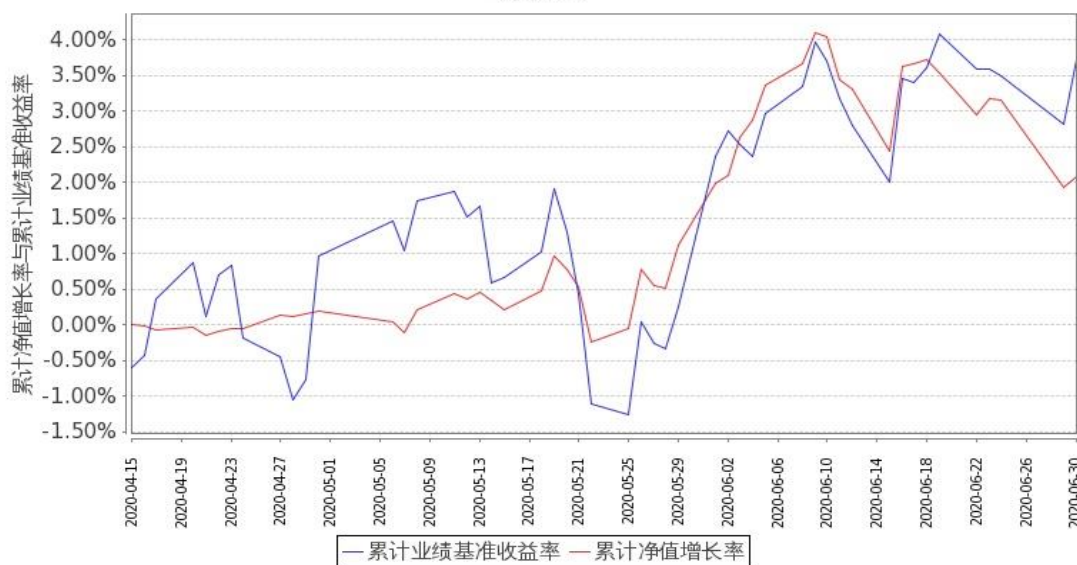
图 2: 嘉实基础产业优选股票 C 基金份额累计净值增长率与同期业绩比较基准收益率的历史走势对比图